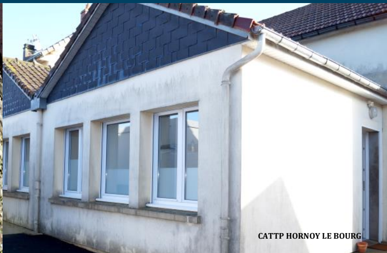
CATTp HORNOY LE BOURG